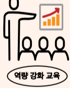
역량 강화 교육