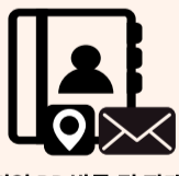
기업 DB 발굴 및 판매